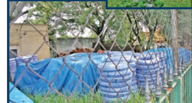
Acima, o reservatório da Vila Mascote, que vem servindo de abrigo para usuários de crack; à esquerda, o de Vila Mariana, que também já abrigou projetos culturais e, abaixo, o da Vila do Encontro, no Jabaquara, onde há pneus e tubulações empilhados - leitora sugere risco de formação de criadouros de mosquitos