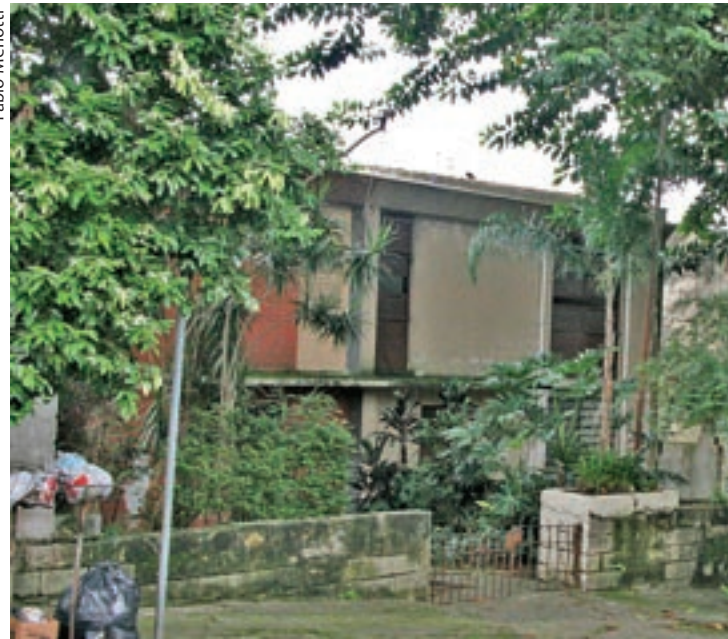
São 22 casas que deveriam ser usadas no projeto da Avenida Água Espraiada, mas a avenida já está concluída e o governo garante que não há projetos para o local