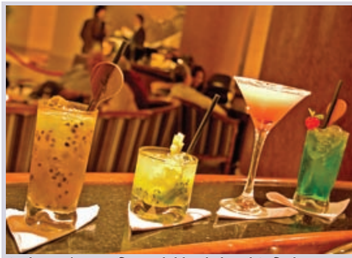
O Aboo Wine Bar fica no lobby do hotel Sofitel, na Rua Sena Madureira, mas não atende apenas hóspedes. Tem vários drinks exclusivos, inclusive um com cachaça premium, carambola e kiwi

O lounge também tem drinks exclusivos, entre eles a Caipirinha Aboo, carro-chefe do bar feito com cachaça premium, carambola e kiwi, além