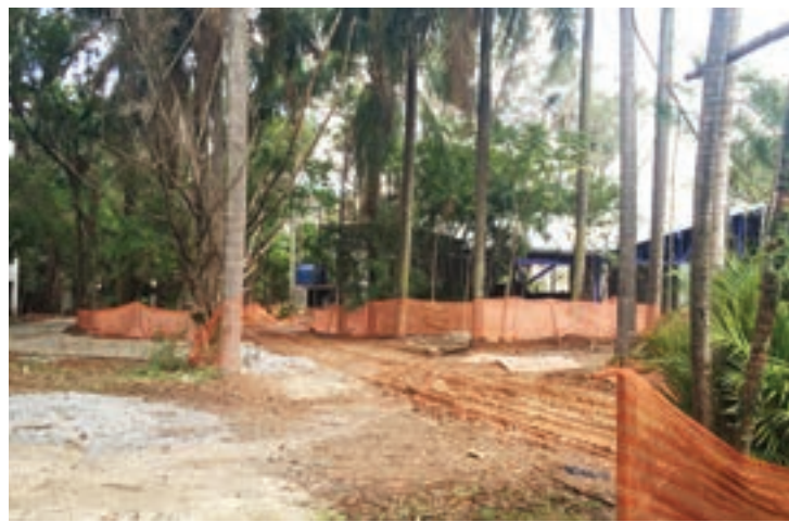
Reformas no local parecem estar longe do fim

Pelos prazos indicados por SP Obras, a família deve deixar o local ainda estes dias