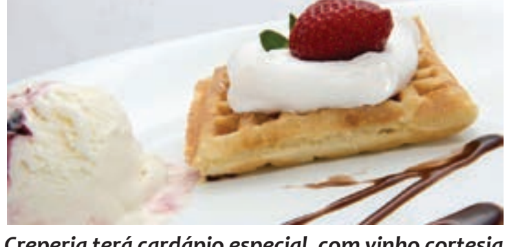
Creperia terá cardápio especial, com vinho cortesia