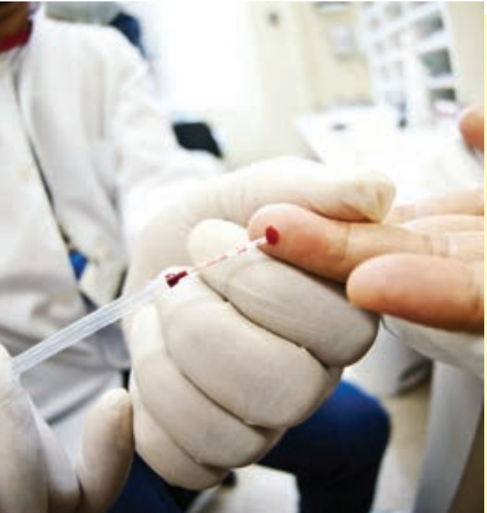
Na região, há Centros que promovem testagem gratuita do vírus HIV gratuitamente