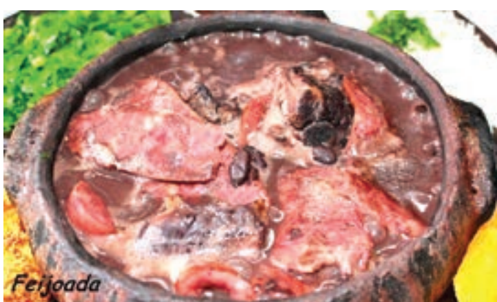
Feijoada do Graça Mineira é uma das mais famosas na região, assim como as caipirinhas oferecidas na casa

Abre de terça a sábado, das 11h30 às 23h e domingos das 11h30 às 17h. Fica na R. Berto Conde, 85 - São Judas. Tel.: 5071-9644.