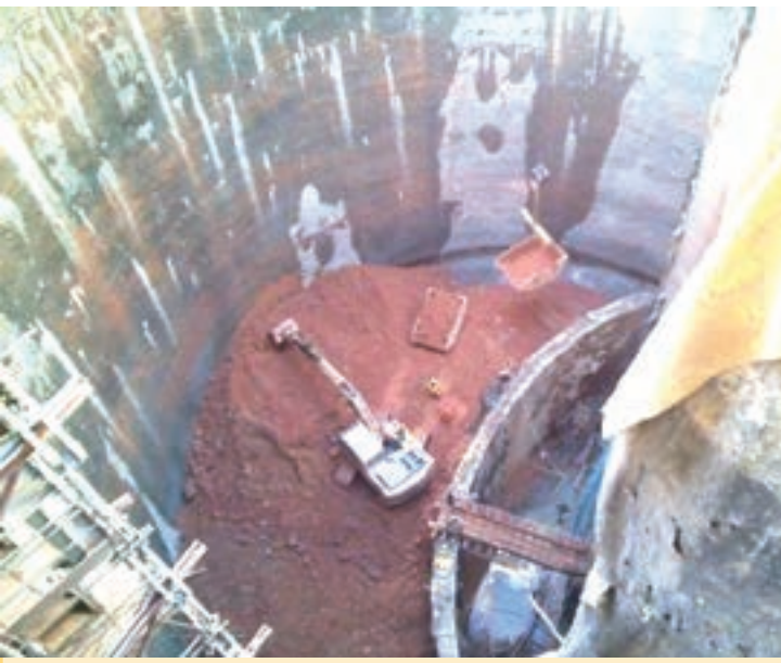
Obras na estação Santa Cruz demonstram a profundidade que terá a futura parada