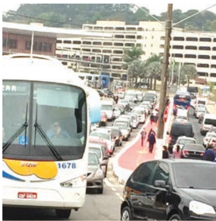
Evento de artesanato está atraindo milhares de visitantes ao SP Expo

O centro de convenções e exposições foi recentemente concedido pelo Governo do