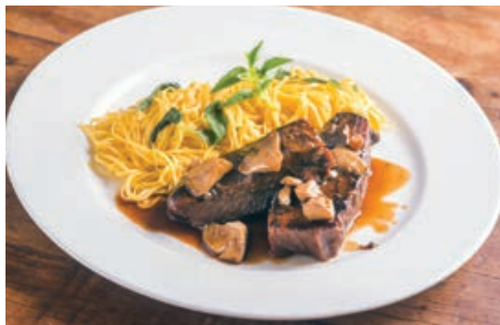
Brasatos são destaque no La Pasta Gialla, mas por tempo limitado: até 4 de setembro

No dia 29 de cada mês uma famosa simpatia italiana vira promoção no La Pasta Gialla: em toda a rede de restaurantes do renomado Chef Sergio Arno acontece o Gnocchi da Fortuna. A tradição diz que colocar uma nota de qualquer valor embaixo do prato ao saborear um gnocchi traz boa sorte e fortuna. Para participar da promoção, basta pedir um dos gnocchi do cardápio, e, como brinde, o cliente recebe um "Vale Gnocchi", válido até o último dia de 2016, para a próxima vez que for ao restaurante La Pasta Gialla.