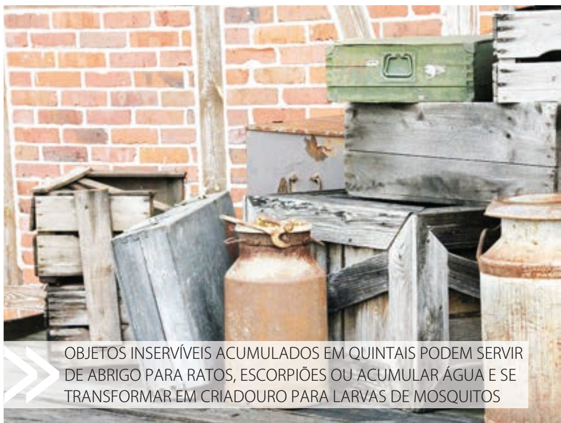
OBJETOS INSERVÍVEIS ACUMULADOS EM QUINTAIS PODEM SERVIR DE ABRIGO PARA RATOS, ESCORPIÕES OU ACUMULAR ÁGUA E SE TRANSFORMAR EM CRIADOURO PARA LARVAS DE MOSQUITOS

O site também mantém informações sobre a coleta de bagulhos e locais adequados e gratuitos para descarte de entulho.