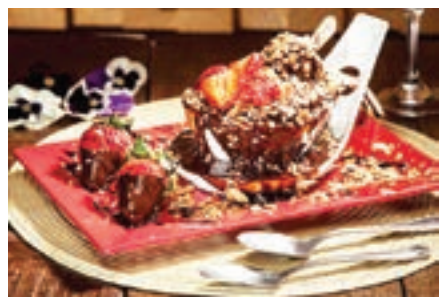
Acima, porção de canapés de carpaccio. Ao lado, o Grand Cake Fortunato: que traz um sorvete Magnum mergulhado em caldas e outras delícias

certamente algum dia vai querer conferir um dos pratos mais famosos da casa: a costela ao molho barbecue, obviamente acompanhada do sucesso certo que são as batatas fritas.