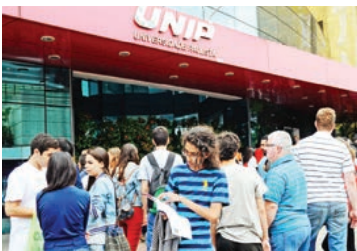
Jovens entram na Unip Vergueiro para prestar ENEM

trazer temas do cotidiano do aluno, mesmo em provas consideradas mais "duras", como matemática. Vários itens abordaram problemas nacionais na área de saúde, como a dengue e a febre amarela. Outro assunto muito presente nos noticiários e que apareceu na prova de matemática foi o nível de reservatórios para abastecimento de água.