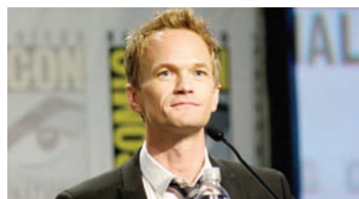
O ator Neil Patrick Harris confirmou presença

A CCXP - Comic Con Experience 2016 acontece entre 1 a 4 de dezembro no São Paulo Expo, próximo à estação Jabaquara do Metrô, com conteúdos para fãs de quadrinhos, cinema, programas de TV, desenhos animados e outras áreas da