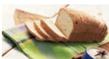
Torta de maçã, pão francês, pão de forma, petit gateau... Delícias para quem busca alimentação saudável e vegana