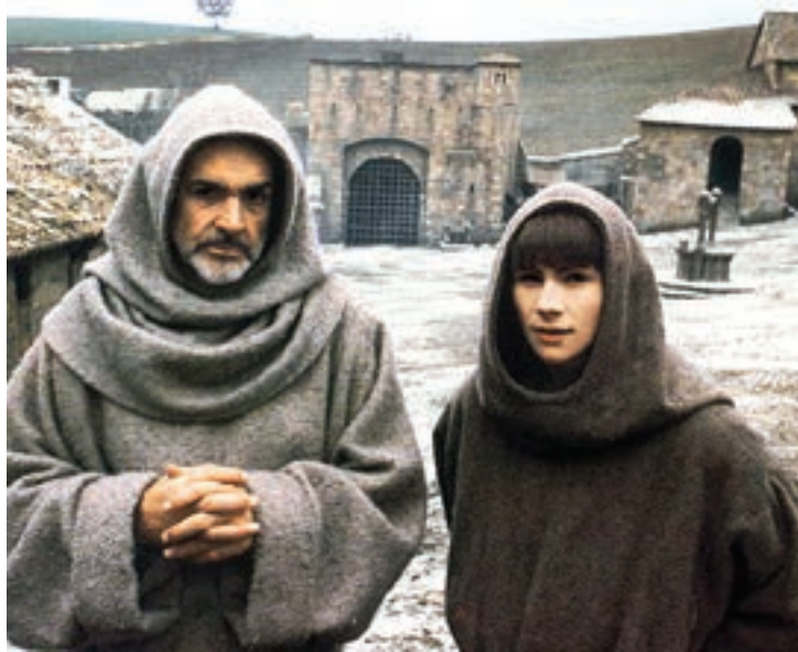
O Nome da Rosa: um dos clássicos que será exibido

A primeira aconteceu ontem, dia 2, e as demais serão também às quintas de março e abril, sempre 20h, em parceria com a Versátil Home Vídeo. É