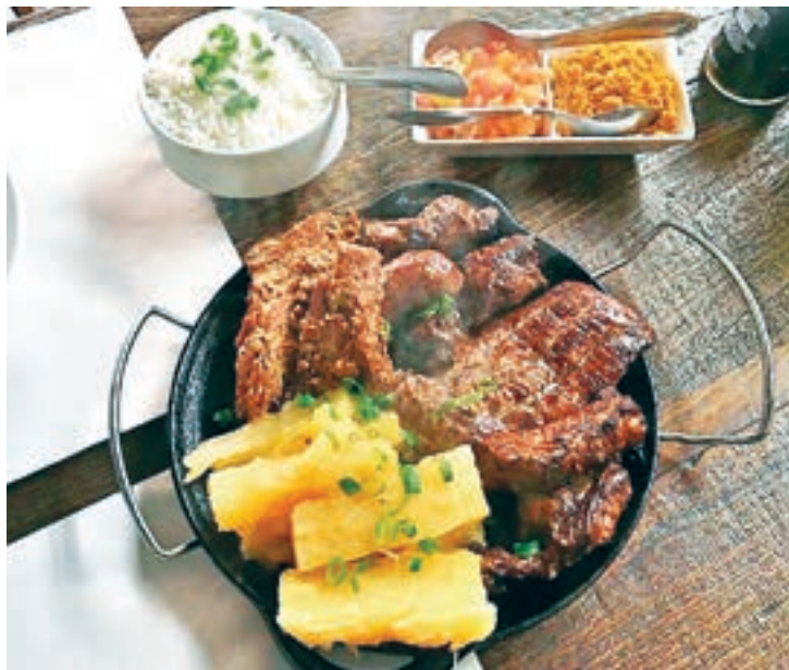
Delícias do Mato Grosso do Sul podem ser entregues em sua casa com desconto de 20%

A casa também é conhecida pelos sobás, um dos pratos mais tradicionais do Mato