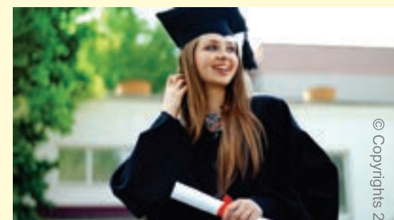
© Copyrights 24/08/2016 Rabbit Partnership. Todos os direitos reservados.