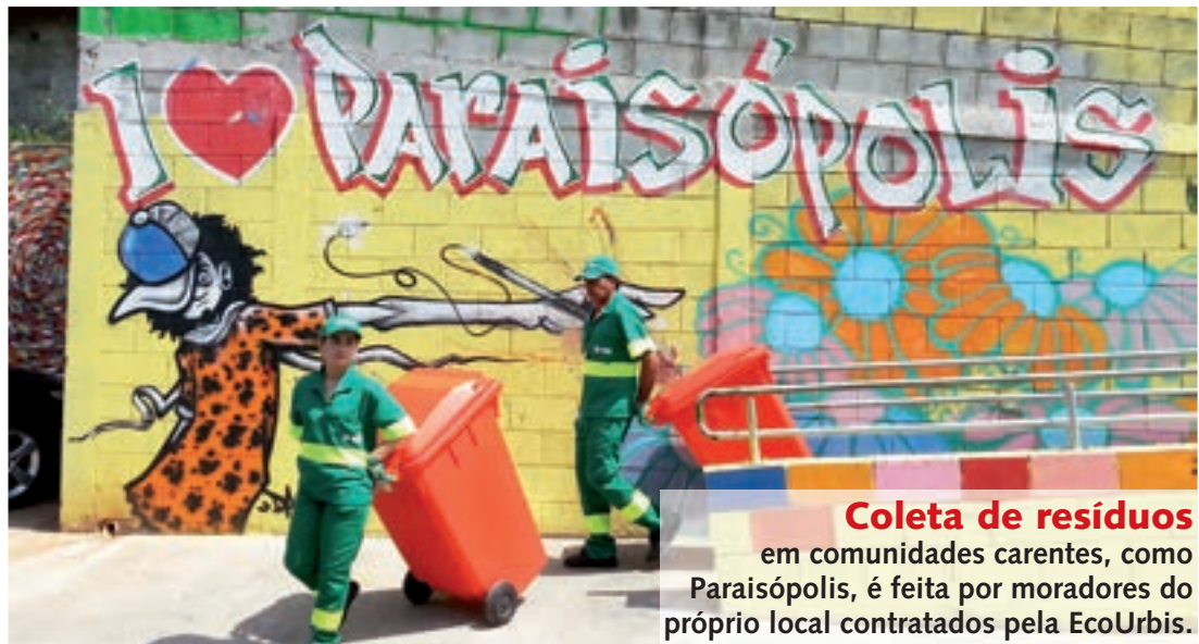
Coleta de resíduos em comunidades carentes, como Paraisópolis, é feita por moradores do próprio local contratados pela EcoUrbis.

A partir da experiência em comunidades carentes, a EcoUrbis ampliou a contratação de mulheres também para a coleta seletiva. Diferentemente da coleta de resíduos domiciliares, cujos sacos são mais pesados e exigem maior força física, na coleta de materiais recicláveis os sacos são leves, pois contêm basicamente garrafas pet, caixas de papelão, embalagens de produtos de limpeza, etc., garantindo que as mulheres