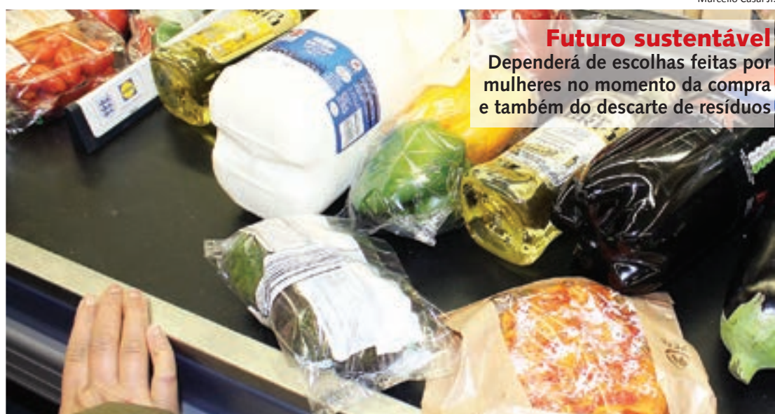
Futuro sustentável Dependerá de escolhas feitas por mulheres no momento da compra e também do descarte de resíduos

Isto significa que os produtos também precisam ter valores acessíveis e boa relação custo-benefício. Por isso, é importante que as empresas também estabeleçam políticas sustentáveis, criando produtos ambientalmente corretos com preços acessíveis.