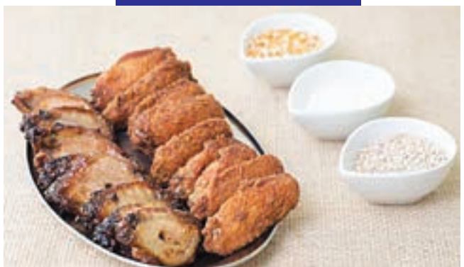
Asinhas Nipon: petisco da Rotisserie Nipon

A Rotisserie Nipon, por exemplo, na Vila Guarani, está oferecendo a "Asinha Nipon".