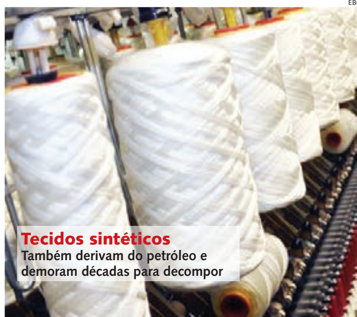
Tecidos sintéticos Também derivam do petróleo e demoram décadas para decompor

Atrás apenas da indústria do petróleo e da agropecuária, a indústria da moda é uma das mais danosas ao meio ambiente. Além do uso excessivo de água e outros recursos naturais, a confecção de roupas também gera muito lixo, já que a maioria das roupas na atualidade é feita para durar apenas uma estação.