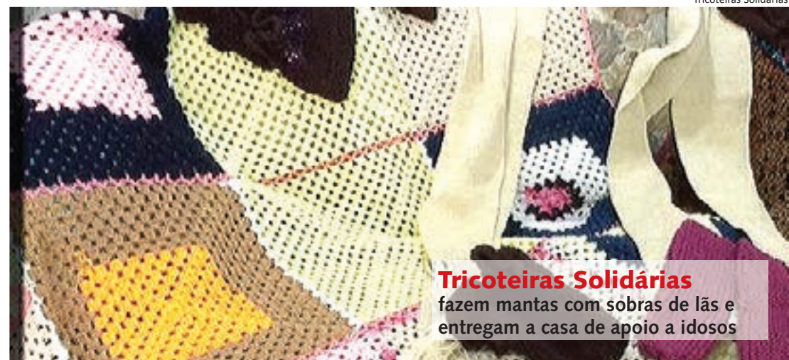
Tricoteiras Solidárias fazem mantas com sobras de lãs e entregam a casa de apoio a idosos

Para mais informações, mande e-mail para rose.pavan@apas.com.br .