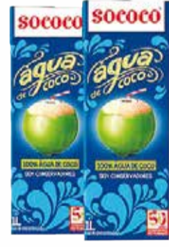
Água de Coco Sococo 1L 5,99