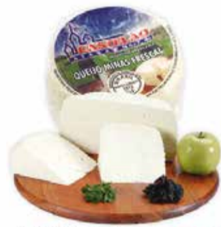
Queijo Minas Frescal Castelão kg 17,90