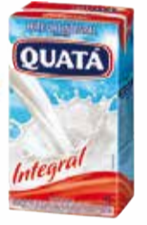
Leite Integral Quatá 1L 2,69