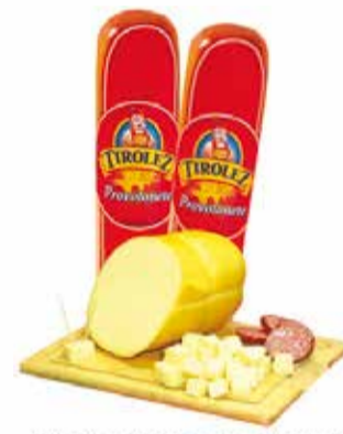
Queijo Provolone Tiroleze Peça/ Pedacoço Fat. cada 100g 3,99