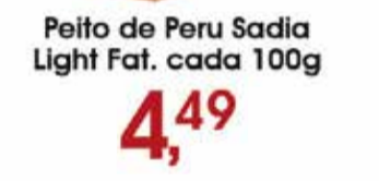
Peito de Peru Sadia Light Fat. cada 100g 4,49