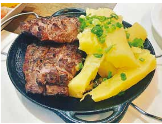
Pacuzinho com mandioca, uma das delícias

O Sobaria traz essa multi cozinha ao seu cardápio: tem sobá, que é um macarrão de inspiração japonesa, mas tem