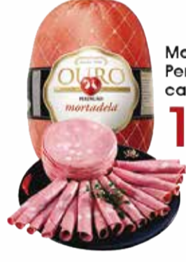
Mortadela Perdigão Fat. cada 100g 1,29