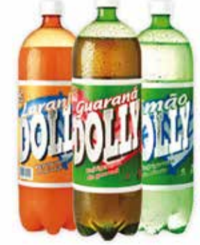
Refrigerante Dolly Guaraná/Laranja/Limão 2L 2,79