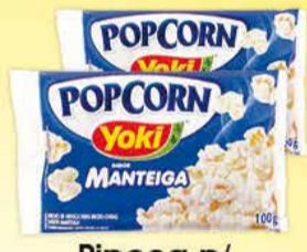
Pipoca p/ Microondas Yoki sabores salgados 100g 1,99