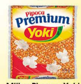
Milho Pipoca Yoki Premium 500g 2,59