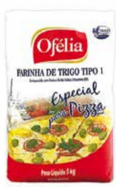
Farinha de Trigo Ofélia Pizza Pct. 5kg 8,98