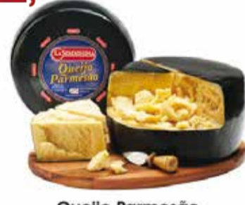
Queijo Parmesão La Serenissima Peça/ Ped. cada 100g 4,99