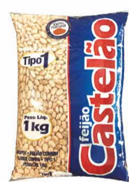
Feijão Carioca Castelão 1kg 4,49