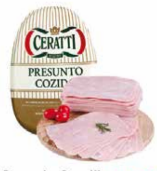
Presunto Ceratti Fat. cada 100g 1,59