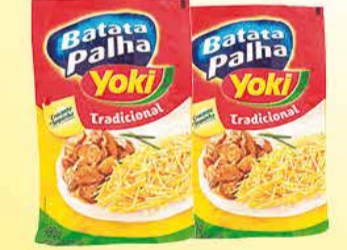
Batata Palha Yoki trad./ Extra Fina 500g 9,95