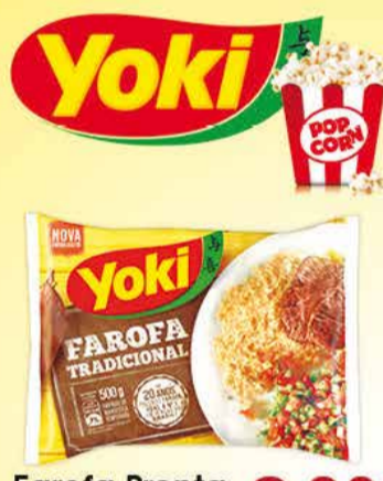
Farofa Pronta Yoki 500g 3,98