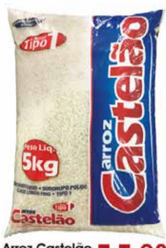
Arroz Castelão TP1 - 5kg 11,98