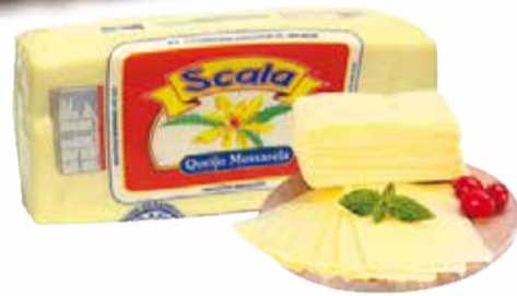
Mussarela Scala Fat. cada 100g 2,25