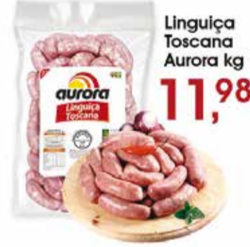
Linguiça Toscana Aurora kg 11,98