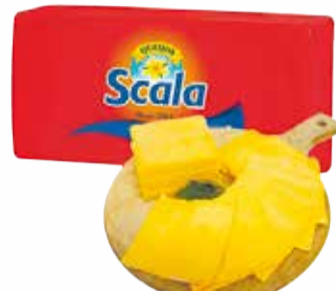
Queijo Prato Scala Fat. cada 100g 2,45