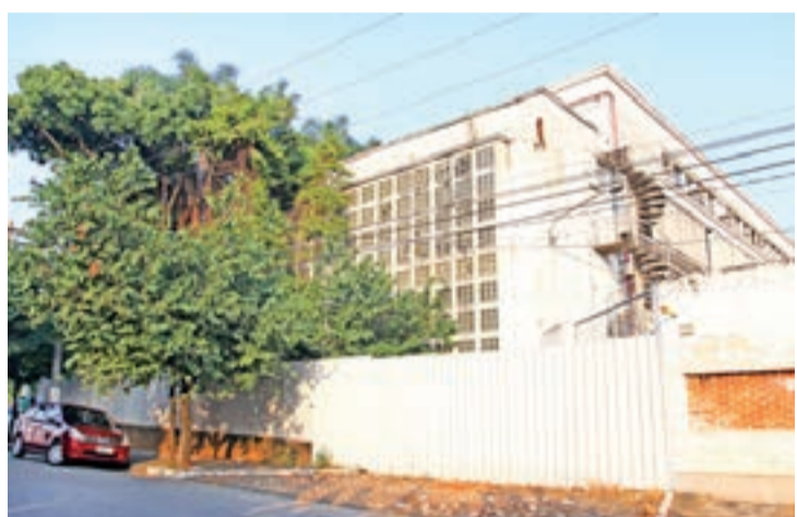
Prédio sede do Creci na Avenida Indianópolis: à espera de projeto de Retrofit, uma forma de modernizar antigas construções, prevista no novo Código de Obras.

De agora em diante, o arquiteto terá a responsabilidade legal de elaborar o projeto em conformidade com a legislação e com as normas