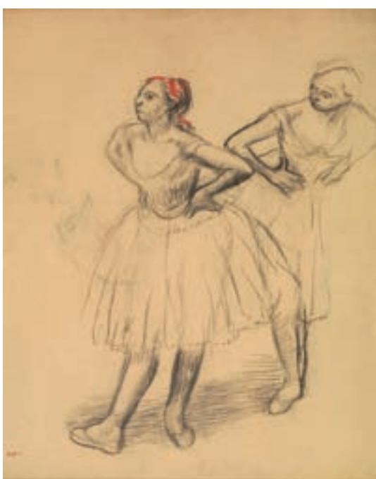
Duas Bailarinas, de Edgard Degas (C. 1890) é um dos desenhos que compõem a exposição

A presença privilegiada dos artistas espanhóis em Paris permitiu-lhes assistir em primeira mão à gestação do surrealismo. Alguns dos pintores apresentados foram membros ativos do grupo e figuras essenciais do movimento, como Salvador Dalí, Joan Miró, Luis Fernán-