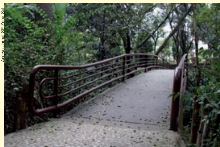
O Parque Lina e Paulo Raia, com apenas 15 mil metros quadrados, é remanescente do antigo Parque do Jabaquara

O proprietário divulgou em um anúncio de página inteira, em setembro de 1910, no jornal "O Estado de São Paulo", em que dizia pretender abrir uma Sociedade Anônima. Quem comprasse cotas, contribuiria para o desenvolvimento agrícola