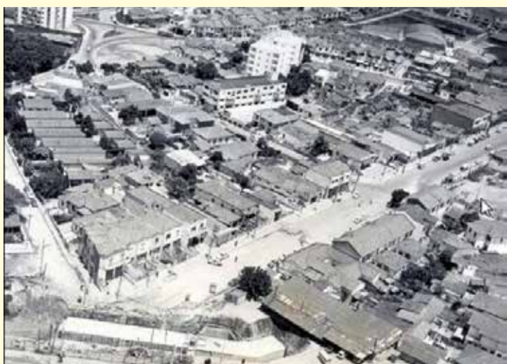
Estação Conceição ainda em construção, década de 1960

rial que é sede administrativa do Banco Itaú/Itaú S/A abriga hoje nada menos que 10 mil funcionários. Um dos grandes diferenciais do projeto está no fato de que os espaços internos, conhecidos pelas poucas barreiras e paredes, além de grande fluidez, integra-se até o espaço externo, ou seja, a Praça Alfredo Egydio de Souza Aranha.