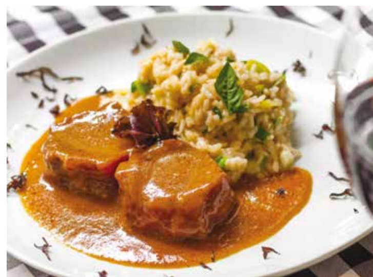
Menu especial do Pier Trattoria, nos Jardins, para o evento

A cervejaria Petra é a patrocinadora oficial do evento e apresenta um menu de Cerveja Especiais, artesanais puro malte para harmonizar com os pratos. Para não perder a oportunidade de conferir toda essa experiência, as reservas podem ser feitas