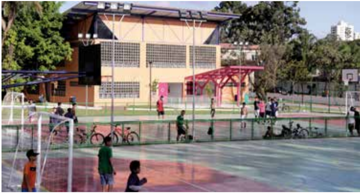
Parque do Chuvisco será reaberto nessa sexta, 30

Ao mesmo tempo em que anunciou o fechamento do Parque da Independência, no Ipiranga, por conta da morte de um sagui, a Prefeitura informou que vai reabrir outros 27 parques municipais que estavam fechados desde outubro por causa do risco de contaminação pela febre amarela silvestre. Vários dos parques ficam na zona sul da cidade.