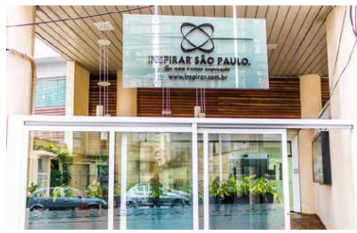
Inspirar tem tradição de mais de 20 anos. Uma das unidades fica na Rua Vergueiro e oferece cursos de aperfeiçoamento

“A Inspirar trouxe para São Paulo, já há seis anos, sua filosofia educacional como instituição de ensino inovadora, preocupada em preparar profissionais capacitados para os desafios do mercado e sempre em busca de novidades para uma