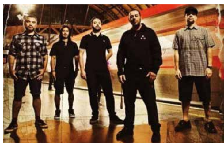
Além de contar com tatuadores internacionais, a Tattoo Week terá shows com artistas como CPM22

Todos os tatuadores que participam do evento possuem essa licença. Durante a Tattoo Week, agentes da COVISA também farão palestras para capacitar e atualizar os tatuadores.